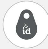
Etiqueta de identificación MSA