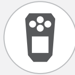
ALTAIR io 4